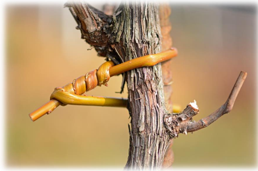
Silberweide 'Capriasca' im Einsatz als Bindeweide