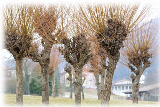
Traditionelle Weidenkultur im Tessin (Sala Capriasca, TI)