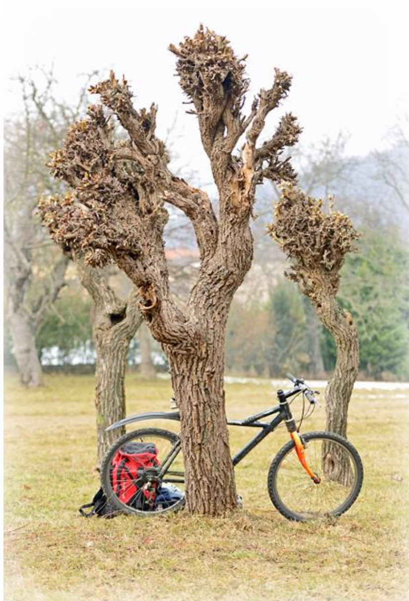
Olivfarbene Binde- und Brennholzweide aus der Südschweiz (männlich)