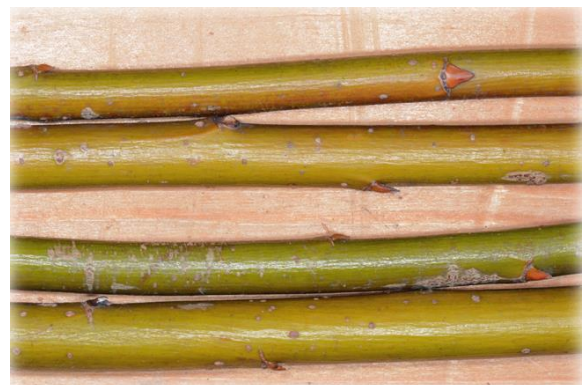
Frisch geerntete Ruten