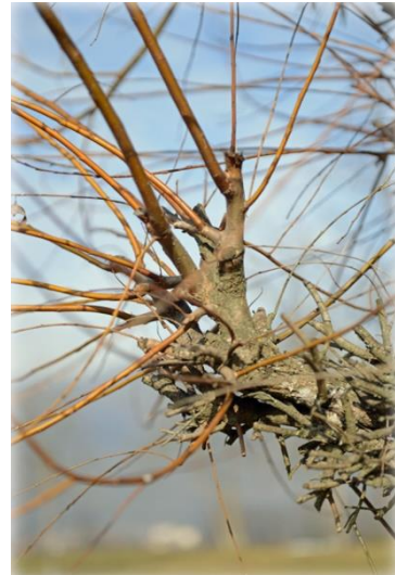
Im Tessin gebräuchlicher Zapfenschnitt