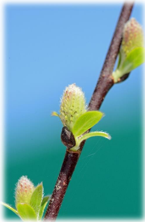
Weibliche Kätzchen zusammen mit Blattaustrieb