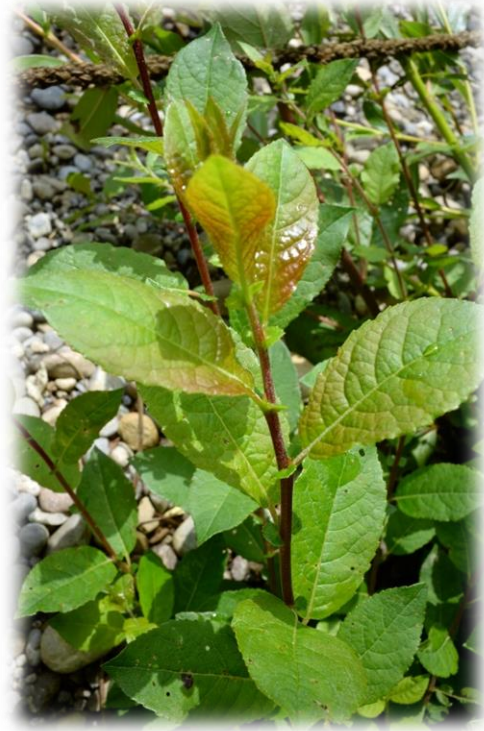
'Faucille' in der Kultur