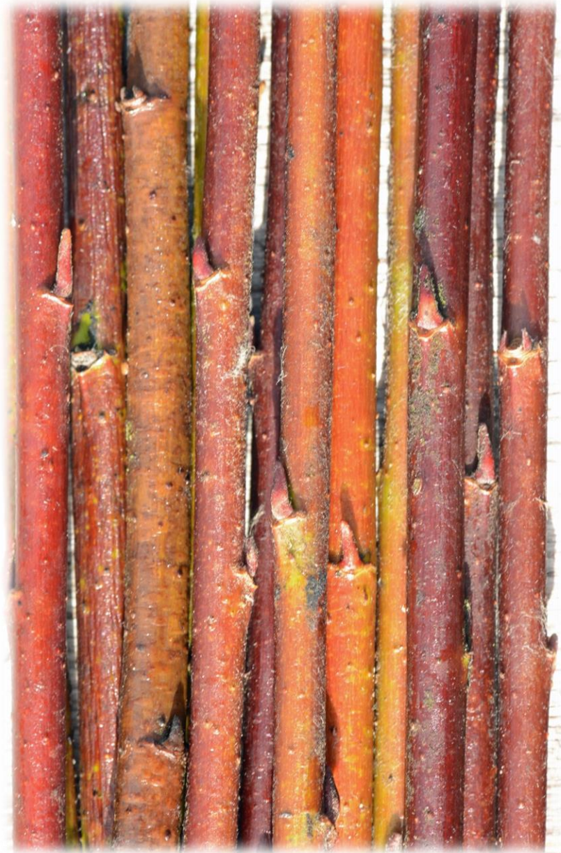
Burgunder-rote bis schwarze Flecht- und Bindeweide (weiblich)