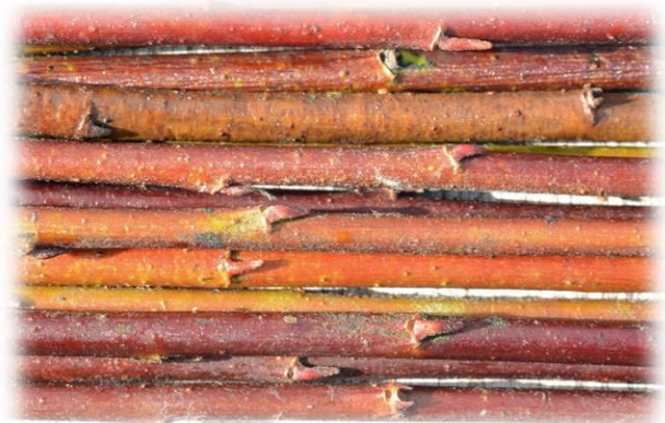
Frisch geerntete Ruten