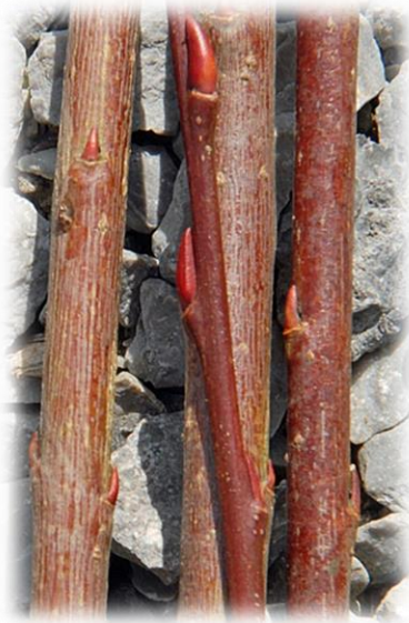
Frisch geerntete Ruten