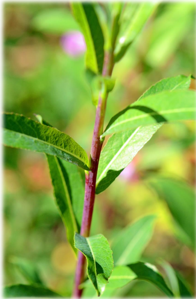
Dunkelviolette Flecht- und Bindeweide (weiblich)