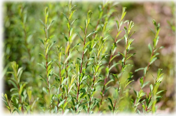
'Dark Dicks' in der Feldkultur