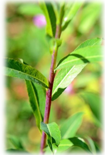
Dunkel ('dark') violett überlaufene Triebe