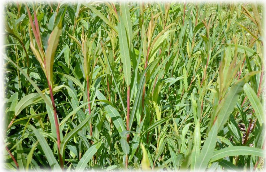
'Light Dicks' in der Feldkultur