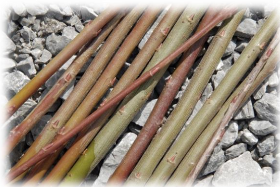
Frisch geerntete Ruten