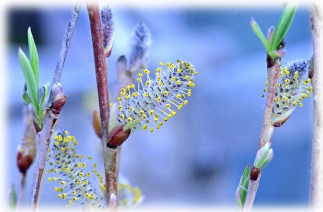
Dekorative männliche Kätzchen kurz vor dem Blattaustrieb - eine Zierde