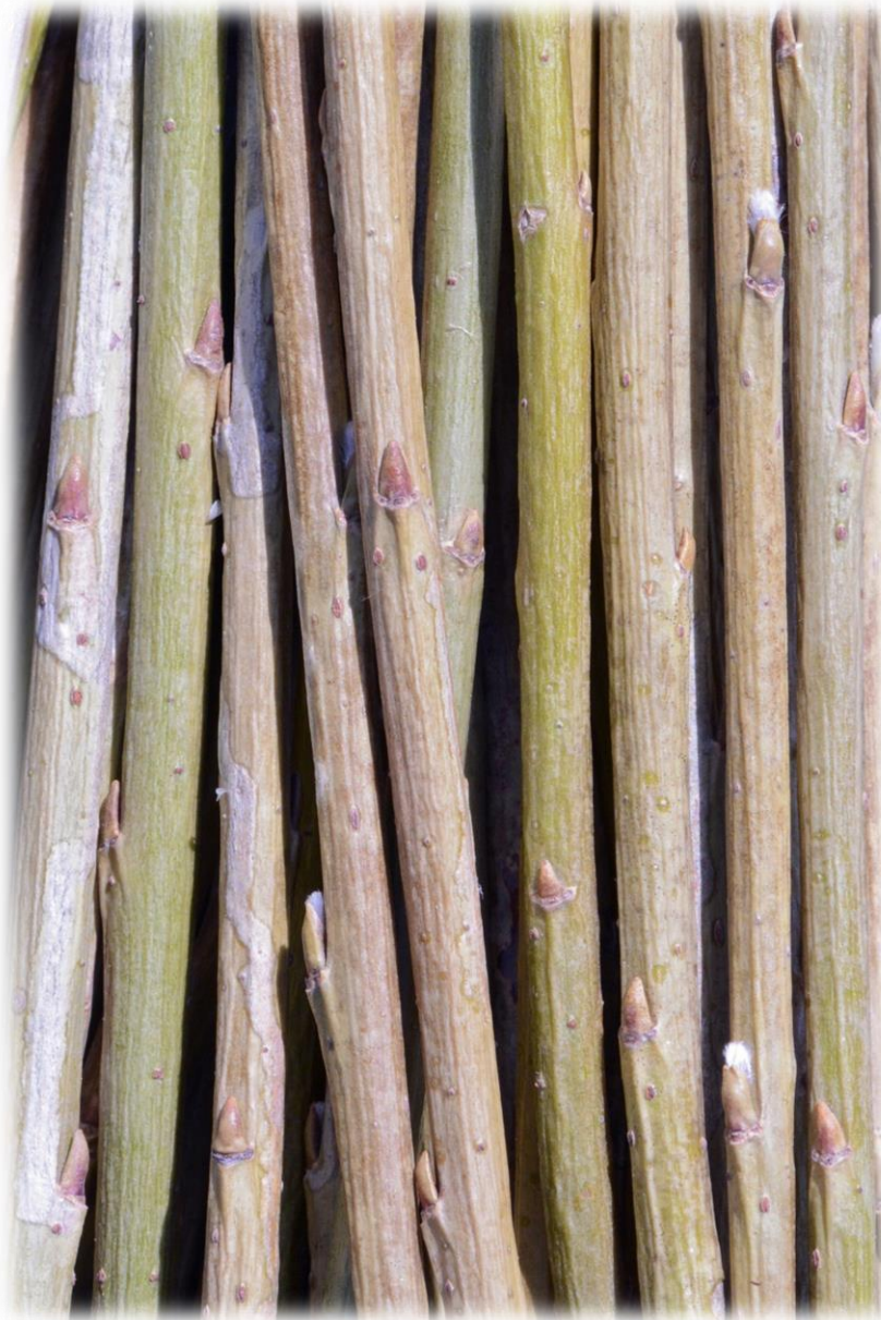
Olive-grüne bis blassviolette Flecht- und Bindeweide (männlich)