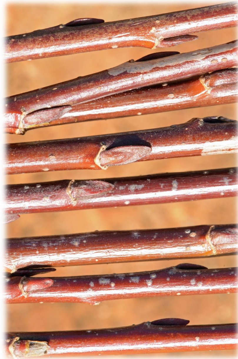
Dunkelrote Flechtweide mit grossen, abgeplatteten Knospen (männlich)