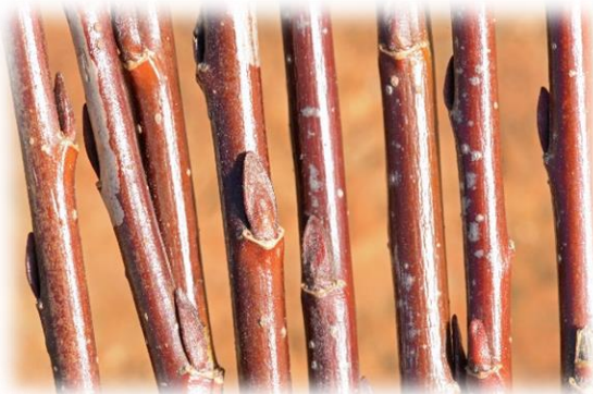
Frisch geerntete Ruten