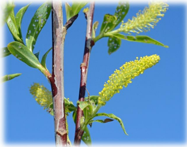
'Bouton Plat' bildet männliche Kätzchen