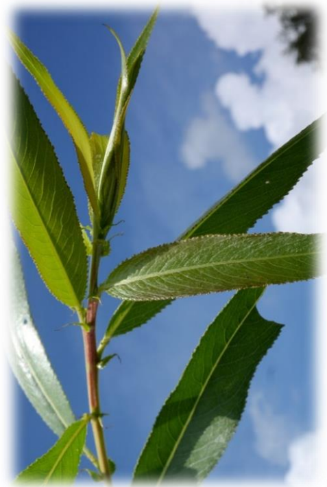
'Bouton Plat' – eine typische Fahlweide