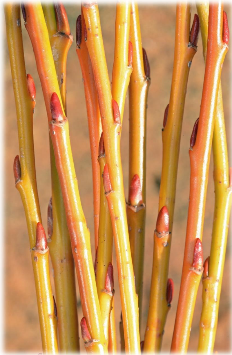
Goldgelbe Binde- und Flechtweide (männlich)