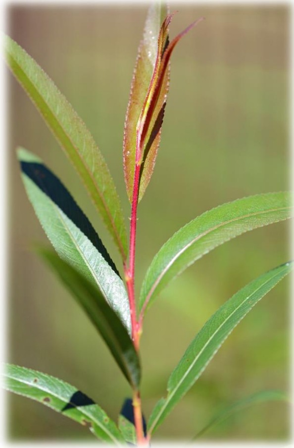
Farbenprächtig - 'Opas Bindeweide' in der Kultur