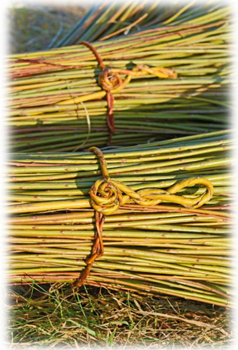
Weidenbund, geschnürt mit 'Opas Bindeweide'